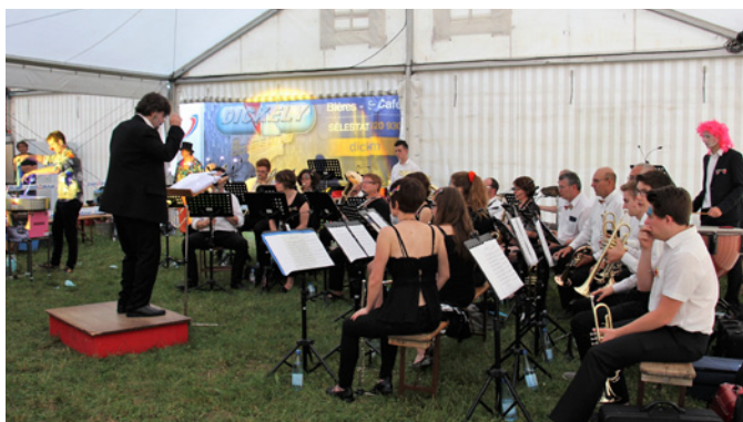
L'association Musique Echo.