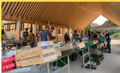
Depuis le 20 juillet, le Marché des producteurs se tient sous et autour de la Halle au Cœur du village. Les nouveaux aménagements permettent de s'installer en toute convivialité pour déguster les produits proposés.