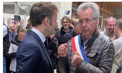
Le 19 avril, dans l'usine Mathis, l'échange avec le Président de la République a été franc et fructueux.