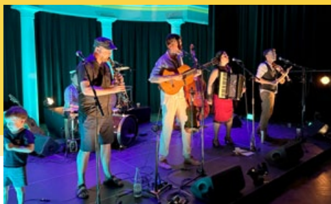
Le 1 er juillet, l'inauguration des Synergies a été musicale, créative, conviviale et festive. Ici le groupe Gadjo Michto.