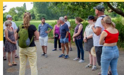
Vendredi 8 juillet, la nouvelle formule de l'animation Ried au pas des villageois a permis aux visiteurs de découvrir les artisans d'Ehnbwibr, ainsi que la centrale hydroélectrique.