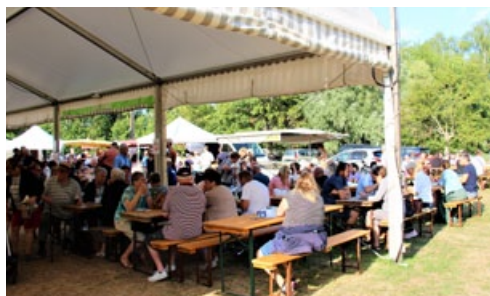
Le Marché du terroir proposé par Loisirs, Découvertes & Traditions a rencontré un beau succès, le 21 juillet.