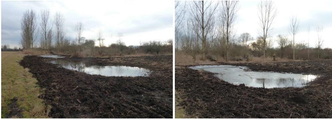
Figure 4 : Photographie de 2011 présentant les mares creusées à l'époque. Celles-ci sont aujourd'hui complètement fermées par la végétation.