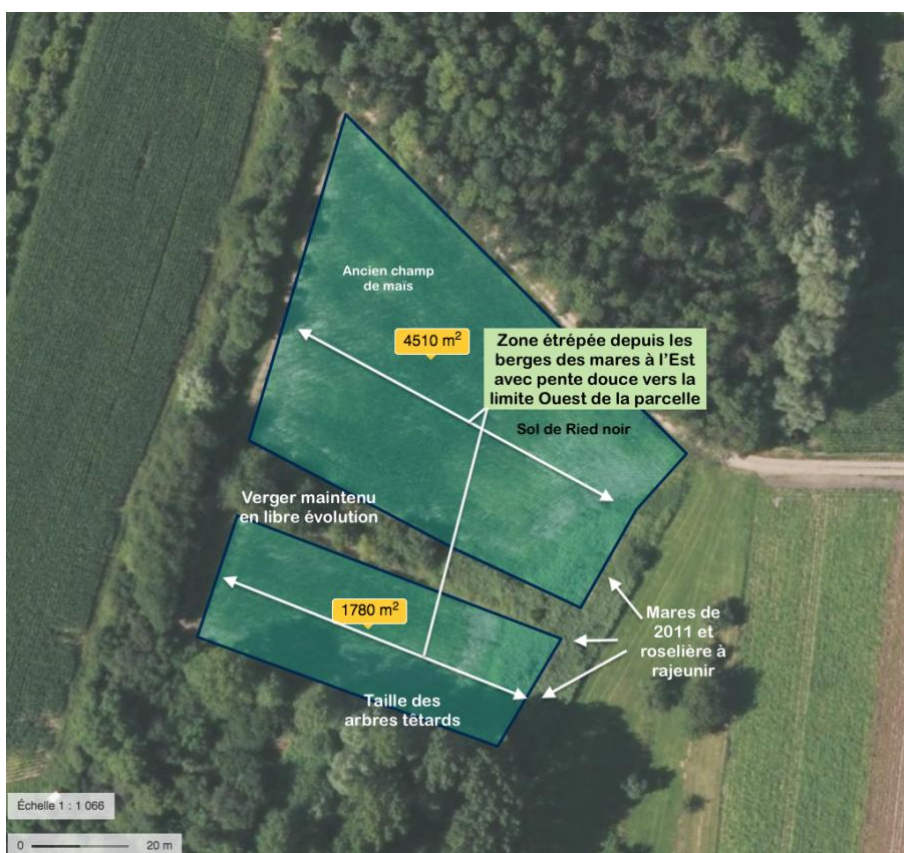
Figure 3 : Projet envisagé pour la parcelle du Fliggerloch.