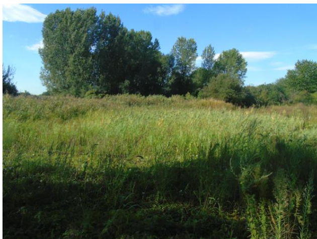
Figure 2 : Aspect de la parcelle en friche en mai 2020. Les mares se sont complètement refermées dans la roselière.