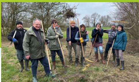
Le 15 mars, au lieu-dit « Oasis » en contrebas de la digue, une dizaine de volontaires, en collaboration avec le Conservatoire d'espaces naturels, ont entretenu la prairie riedienne.