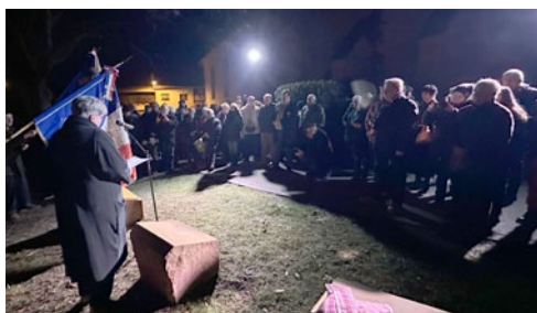
Le 31 janvier, 80 ans après la Libération, Muttersholtz a dévoilé une nouvelle stèle au Monument aux morts.