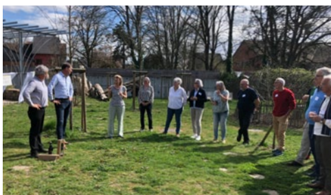
Le 22 mars et le 5 avril, dans le cadre de la coopération transfrontalière, des citoyens de Voerstetten et de Muttersholtz ont échangé des idées sur le thème de la mobilité.