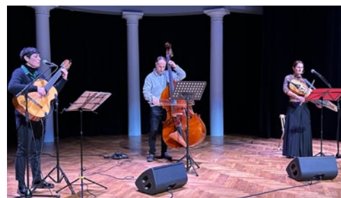
Le 16 mars aux Synergies, après le polissage des Stolpersteine, le Trio « Yiddisch Tango » a régalé l'assistance.