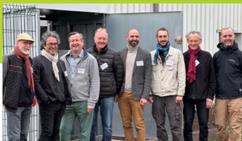
Inauguration du toit photovoltaïque sur l'atelier communal : bravo aux bénévoles des centrales villageoises.