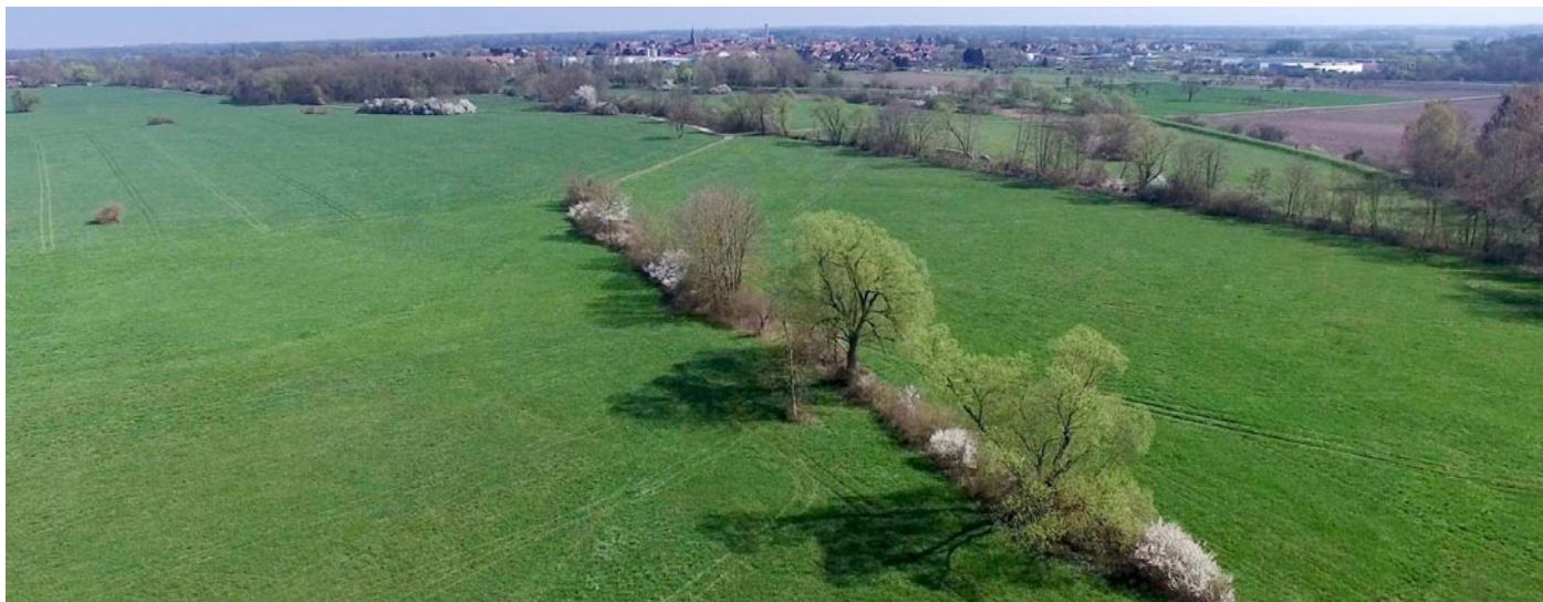
Les haies des « Erlenmatten ».