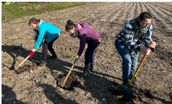
Plantation en mars 2025 le long du nouveau passage entre les quartiers de Reiskirchen et du Bruchfeld avec l'association « Aux arbres citoyens ».

Voir pepiniere-hanfgranva.fr et interview d'Arnaud Schwartz.