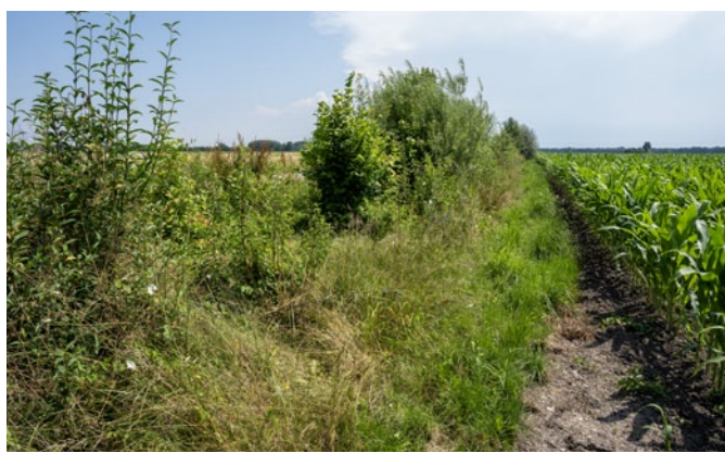
Une haie plantée en 2020, grâce au dialogue avec les agriculteurs du village.

Découverte de la trame verte et bleue à vélo et en mobigoutte. Départ samedi 17 mai à 9 h depuis la place des Tilleuls avec son vélo. Durée 3h.