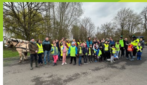
Beaucoup de monde pour l'Osterputz le 29 mars mais, bonne nouvelle, des déchets en diminution.