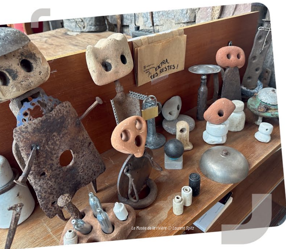
Le Musée de la rivière

Laurent Spitz, vigneron retraité à Epfig, arpente inlassablement les rivières d'Alsace centrale pour les débarrasser des déchets qu'elles réceptionnent. Avec ces objets caractéristiques de notre société de consommation, il réalise des œuvres de récup'art à la fois sensibles, humoristiques et questionnantes. L'exposition s'adresse à tous les publics, y compris aux jeunes enfants.